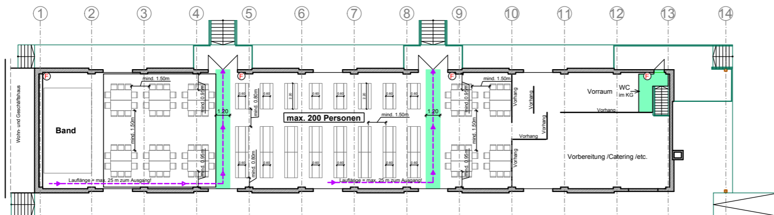
Bestuhlungsvariante 4: "Tische / Ausstellung / etc." für max. 200 Besucher